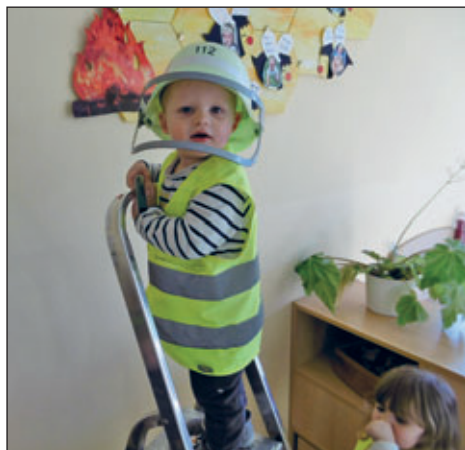
Die Bienen des Naturkinderlands in Grumbach

Feuerwehr konnten die Kinder entdecken, was Feuerwehrleute alles machen, welche Fahrzeuge es gibt und warum die Arbeit so wichtig ist. Besonders kreativ wurde es bei unseren Bastel- und Malangeboten. Die Kinder gestalteten Feuerwehrhelme aus Papptellern, die anschließend stolz getragen wurden. Außerdem entstanden tolle Feuerwehrbilder mit Fußabdruck-Feuerwehren. Unser spannendes Feuerwehr-Projekt ging viel zu schnell zu Ende – und vielleicht träumt der ein oder andere schon davon, später einmal selbst Feuerwehrfrau oder Feuerwehrmann zu werden.