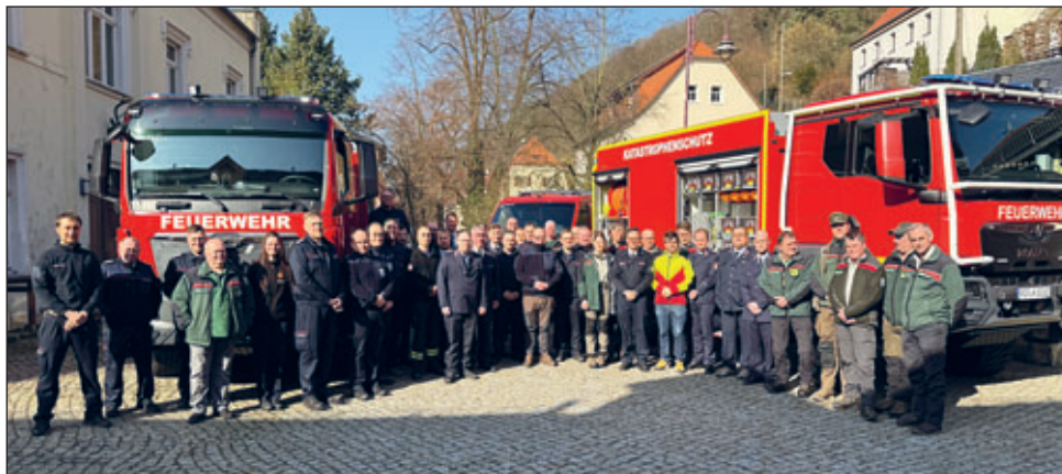
Mitglieder der Freiwilligen Feuerwehren aus der Sächsischen Schweiz, Mitarbeitende der Nationalpark- und Forstverwaltung Sachsenforst und Vertreter des Landratsamtes Sächsische Schweiz-Osterzgebirge

Beide Treffen behandelten zentrale Themen des vorbeugenden und abwehrenden Waldbrandschutzes. Im Mittelpunkt stand unter anderem die Auswertung des Waldbrandes in der Gohrischheide im Jahr 2025. Dabei wurden wichtige Erfahrungen aus dem Einsatzgeschehen vorgestellt und besprochen. Ein weiterer Schwerpunkt war das Fähigkeitsmanagement am Beispiel eines Hilfeleistungseinsatzes in der Gohrischheide. Hierbei ging es darum, welche Fä-