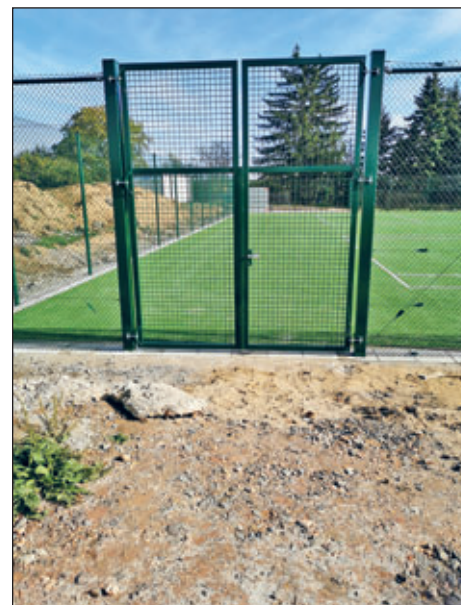
Fertigstellung Tennisplatz neu