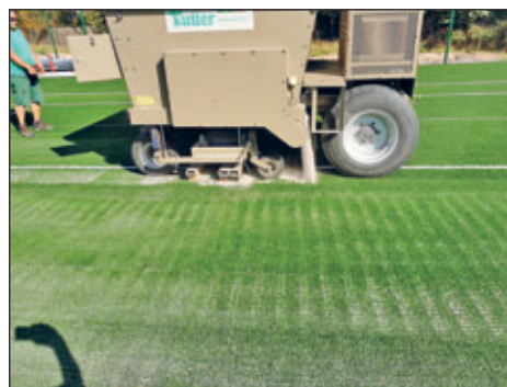
Baufortschritt Tennisplatz neu