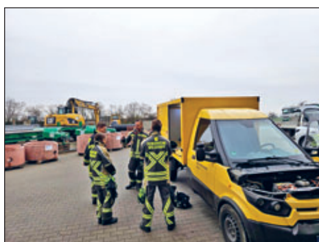
Station „E-Mobilität“, Besonderheiten und Vorgehensweisen