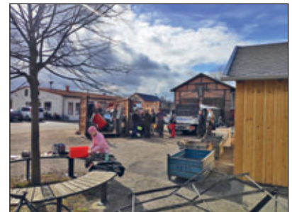
Der Sammelplatz am Gerätehaus Mohorn

Am Samstag, 16. März 2024 führte die Jugendfeuerwehr Mohorn/Grund eine Schrottsammlung durch. Im Laufe des Tages füllten sich vor dem Gerätehaus in Mohorn zwei große Container mit Schrott den die Mitglieder der Jugendfeuerwehr mit Hilfe der erwachsenen Kameraden zusammengetragen hatten. Die Mitglieder der Jugendfeuerwehr sowie deren Jugendwarte bedanken sich bei allen Bürgerinnen und Bürgern herzlich, die Schrott zur Verfügung gestellt haben. Der Erlös kommt der Arbeit der Jugendfeuerwehr zugute.