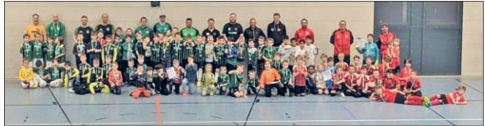
Start für die F-Jugend