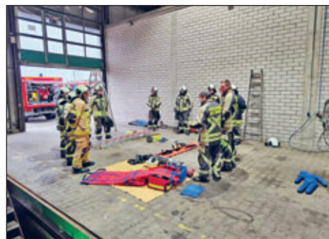
Station „Retten von Personen aus Tiefen“