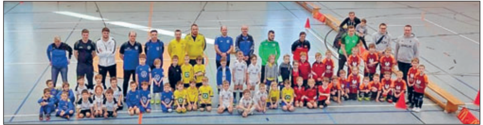
Turnierstart mit den Kleinsten