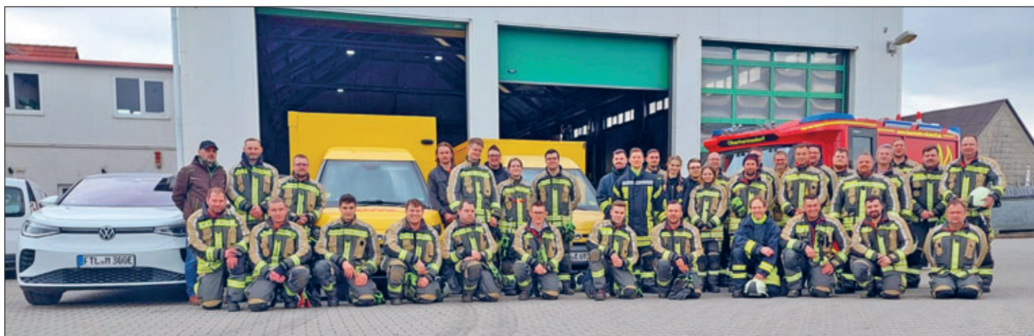
Abschlussfoto mit allen Teilnehmern der Ortsfeuerwehren im Bereich 3

Impressum: Herausgeber: Verantwortlich für den amtlichen Teil: Bürgermeister Ralf Rother. Verantwortlich für den nichtamtlichen Teil: Bürgermeister Ralf Rother bzw. die Leiter der zeichnenden Einrichtungen bzw. Verbände. Lokales, Vereine, Veranstaltungen: Verlag. Verantwortlich im Sinne des Presserechts sind die Text- bzw. Bildautoren. • Verantwortlich für Redaktion, Satz, Druck, Anzeigen, Vertrieb: Riedel GmbH & Co. KG, Gottfried-Schenker-Straße 1, 09244 Lichtenau/OT Ottendorf, Telefon: 037208 876-0 • Fax: 037208 876299 • E-Mail: info@riedel-verlag.de, Verlagsleitung: Hannes Riedel. Verantwortlich für den Anzeigenteil: Reinhard Riedel. Es gelten die AGB der Riedel GmbH & Co. KG. • Ansprechpartner für das Amtsblatt in der Stadtverwaltung ist Katja Pfützner, Telefon: 035204 463-102 • E-Mail: amtsblatt@swilsdruff.de . •