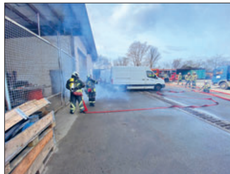
Station „Gruppe im Löscheinsatz“ nach Feuerwehrdienstvorschrift 3