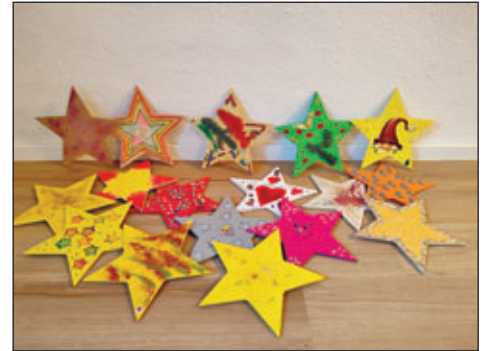
Kinder aus 4 Kindertageseinrichtungen haben diese 17 Sterne gestaltet