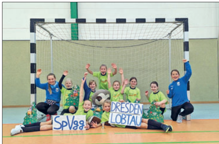
Platz 2 sicherten sich die Mädels der SpVgg Dresden-Löbtau