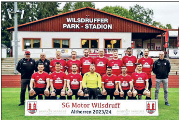
Die Alten Herren aus Wilsdruff

„Einen guten Rutsch, sowie ein gesundes, erfolgreiches und sportliches neues Jahr“, wünscht die Abteilung „Alte Herren“ der SG Motor Wilsdruff allen Lesern und Leserinnen des Amtsblattes. Wie zu Beginn eines jeden Jahres möchten wir wieder alle Fußballbegeisterten zu einem sportlichen Highlight einladen. Das „21. Mitternachtsturnier der Alten Herren“ in der Saubachtalhalle zu Wilsdruff findet am 13. Januar 2024 ab 17:00 Uhr statt. Somit starten unsere Fußballer in die alljährliche Hallenturniersaison. Der Eintritt ist für alle frei, die Halle ist geheizt, die Stimmung wie immer großartig und für das leibliche Wohl ist gesorgt. Wieder treffen sich eine Vielzahl bekannter regionaler Mannschaften zum sportlichen Wettkampf. Unser Ziel ist, es wie in jedem Jahr gut in das Turnier zu kommen, viele Punkte zu sammeln und am Ende den Pokal in der Hand zu halten. Dazu brauchen wir die Unterstützung aller Leser. Lassen Sie unser Turnier zu einem echten Heimvorteil werden und kommen Sie zahlreich vorbei. Wir bedanken uns schon jetzt für Ihre Unterstützung, sowie bei allen Sponsoren dieser Veranstaltung. Mit lieben Grüßen und einem kräftigen „Sport frei“ sehen wir uns Anfang Januar.