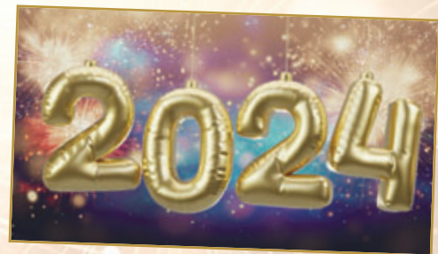
Ihr Bürgermeister Ralf Rother