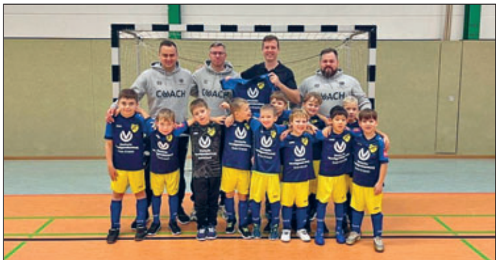
Vielen Dank allen Mannschaften und Trainern