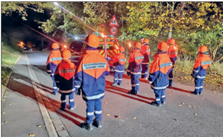
Die Jugendfeuerwehr Mohorn/Grund begleitete den Martinsumzug am 12. November über die Mohorner Bahnhofstraße und den Südhang