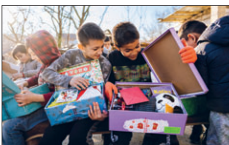
WOW!