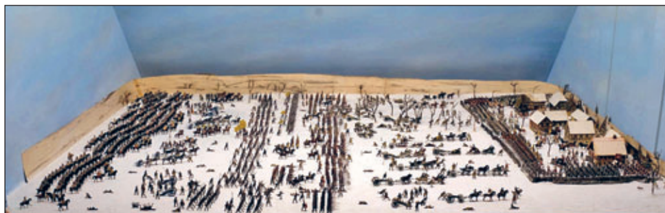
Diorama vor dem Abbau