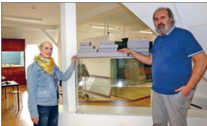
Diorama verpackt in Schachteln

Breite und 1,30 m Tiefe. Die durchschnittlich 3 cm hohen Figuren wurden gereinigt und in Archivkartons verstaut. Dabei erfolgte die Sortierung nach Bataillonen und Szenen mit zehn bis zwanzig Figuren, die in einem so großen Diorama die Anschaulichkeit verstärken. Das Gelände wurde ursprünglich im Maßstab 1:200, die Gebäude im Maßstab 1:80 und die Figuren 1:60 angefertigt. Zur Wiedereinrichtung des Museums nach den Baumaßnahmen soll alles geschickt und detailliert wiederaufgebaut werden, denn das Diorama veranschaulicht ein historisches Ereignis. Der Wilsdruffer Ortsteil Kesselsdorf war am 15. Dezember 1745 ein Schauplatz in der europäischen Geschichte. Bei der Kesselsdorfer Schlacht verloren sehr viele Menschen ihr Leben und der Lauf der sächsischen und deutschen Geschichte wurde merklich beeinflusst.