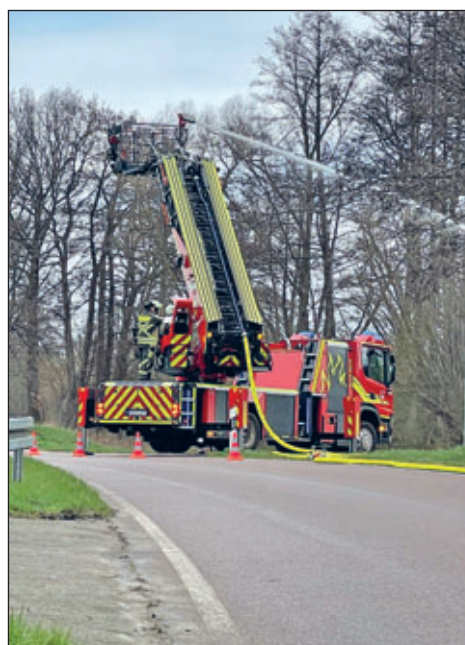
Wasserabgabe über die Drehleiter mit einem motorisierten Wasserwerfer.

deine Ausbildung vom Feuerwehrmann bis z. B. zum Maschinisten absolvieren. Dann darfst du auch die großen Feuerwehrfahrzeuge fahren.