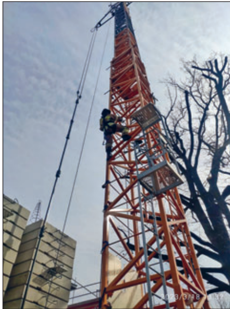
Die Kameraden sind an einem Kran hinaufgeklettert und haben sich dabei fachgerecht gesichert.

Das Arbeiten in absturzgefährdeten Bereichen erfordert zum einen sehr viel Vorbereitung, zum anderen eine spezielle Ausbildung. Diese haben wieder einige Kameraden aus Wilsdruff und Freital abgeschlossen. Den praktischen Teil haben die Kameraden in Wilsdruff auf der Baustelle an der Oberschule durchführen können. Die Firma HIW aus Wilsdruff hat hierfür ihren Kran zur Verfügung gestellt. So konnten die Kameraden sehr realitätsnah die Theorie in die Praxis umsetzen.