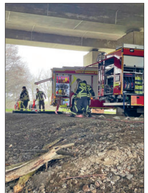
Aufbau der Wasserentnahmestelle an einem flach fließenden Gewässer.