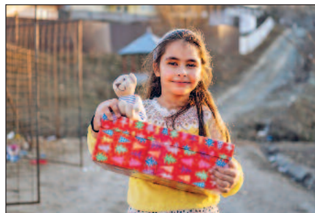
Mädchen in Rumänien freut sich über ihren Schuhkarton