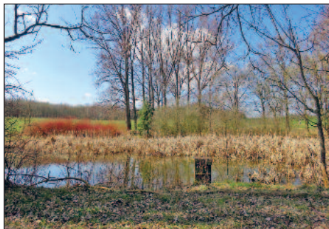
Biotopeteich bei Wilsdruff

Teiche auf eingefriedeten Grundstücken sind bisher nicht im Stillgewässerkatalog erfasst. Ei- gentümer und Landnutzer, welche sanierungs- bedürftige Teiche oder Kopfweiden besitzen und eine Beratung zu Fördermöglichkeiten wünschen, sind aufgerufen, sich ab Januar 2023 an den Landschaftspflegeverband zu wenden. In den kommenden zwei Jahren liegt