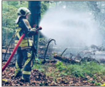
... und ist immer mit an vorderster Front, hier in der Sächsischen Schweiz beim Waldbrand 2022.

Da mein Papa selbst viele Jahre in der Freiwilligen Feuerwehr aktiv war, wurde mein Interesse schon frühzeitig geweckt. Als Kind fing ich an in einem Verein zu tanzen, da fand sich leider keine Zeit für die Jugendfeuerwehr. Nach meiner Ausbildung zur Krankenschwester zog ich in ein kleines Dorf bei Meißen, dort wurde ich von einem Schulfreund gefragt, ob ich Lust habe in die Feuerwehr einzutreten, davon war ich natürlich begeistert. Als ich Ende 2020 zurück in meine Heimatstadt zog, zögerte ich nicht lang in die Ortsfeuerwehr Wilsdruff einzutreten.