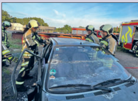
Besonders die schonende Rettung bringt Mensch und Technik oft an ihre Belastungsgrenze.