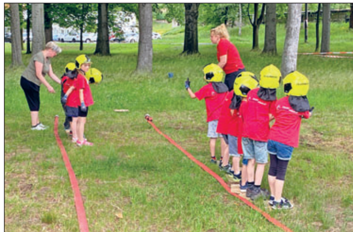
Mit Spiel und Spaß vermitteln wir Teamgeist und Feuerwehrwissen

In der Kinderfeuerwehr Wilsdruff können Kinder im Alter von 5 bis 7 Jahren mitmachen. Die Dienste finden immer am Samstagvormittag aller zwei Wochen statt. Wir möchten die Begeisterung an der Feuerwehr fördern und die Kinder spielerisch an das Ehrenamt und die Aufgaben der Feuerwehr heranführen. Ab 8 Jahren können die Kinder dann in die Jugendfeuerwehr wechseln.