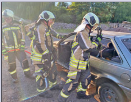
Personen aus schwer verunfallten Fahrzeugen zu retten ist immer eine Herausforderung.