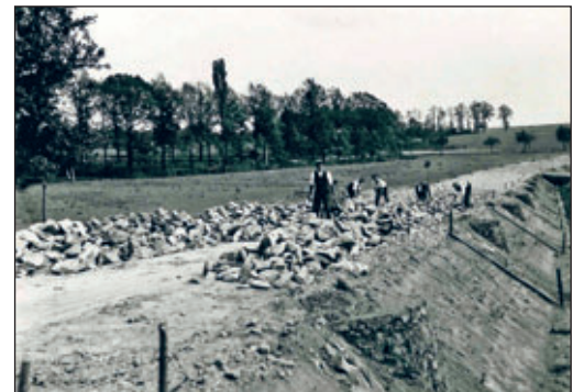
Straßenbau in Wilsdruff, um 1930/40er Jahre