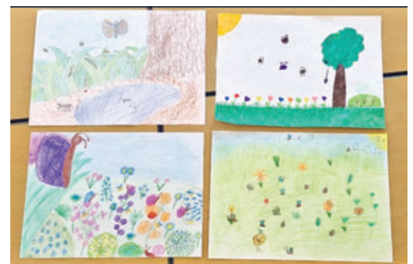
Hannah aus Achat

In Zukunft wird ein Stück der Wiese auf dem Schulgrundstück nicht mehr gemäht, damit dort Insekten und Tiere leben können. Dazu haben wir auch einen kleinen Malwettbewerb veranstaltet. Die schönsten Bilder seht ihr hier.