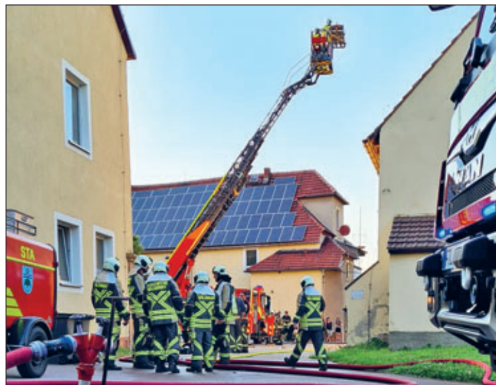
Foto unten: Die Kameraden der OF Mohorn beim Setzen des Standrohrs direkt am Objekt • Foto rechts: Die Drehleiter beim Retten einer Person mittels Korbtrage. • Foto rechts unten: Auswertung der Übung am Gerätehaus der OF Blankenstein.

Die Ortswehren Blankenstein, Helbigsdorf, Herzogswalde und Mohorn haben am 10. Juni 2022 in Blankenstein eine Bereichsübung durchgeführt. Mehrere Personen sollten sich noch in einer brennenden Scheune aufhalten. Mit mehreren Trupps sind die Ortswehren Herzogswalde und Mohorn zur Menschenrettung eingesetzt wurden. Ausgerüstet mit Atemschutz, Axt und Strahlrohr sind die Trupps in das Gebäude vorgegangen, um die Personen aufzusuchen und ins Freie zu verbringen. Dort wurden sie zur medizinischen Erstversorgung übergeben. Die Ortswehr Helbigsdorf stellte mit reichlich Schlauchmaterial eine stabile Wasserversorgung her. Bei Bränden größerer Gebäude werden mehrere Kubikmeter Wasser pro Minute benötigt. Auch hier kam die Drehleiter der Ortswehr Wilsdruff mit zum Einsatz. Der Wasserwerfer, der am Drehleiterkorb angebracht