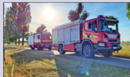
Es wurden folgende Grundfahrübungen absolviert: 2 km rückwärtsfahren auf der alten B173, Notbremsübung mit 30 bis 50km/h, wenden in einem 12 x 12 Meter großen Rechteck.