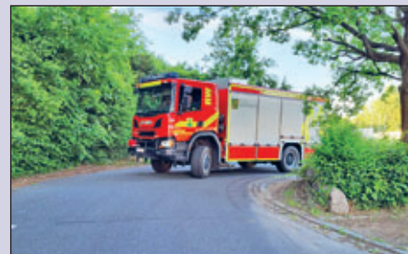
Jeden Tag erleben wir eine Vielzahl von Fahr- und Einsatzsituationen. Training ist daher sehr wichtig. Die Maschinisten der Ortswehr Kesselsdorf haben dazu einen Dienst mit verschiedenen Fahrsituationen gehalten.