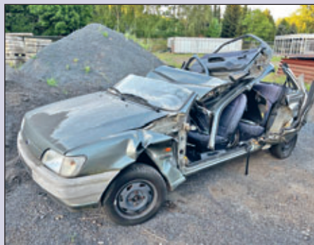
Mit der neuen Technik (unter anderem vom Hilfeleistungslöschfahrzeug 20 der OF Wilsdruff) sind wir hervorragend ausgerüstet.