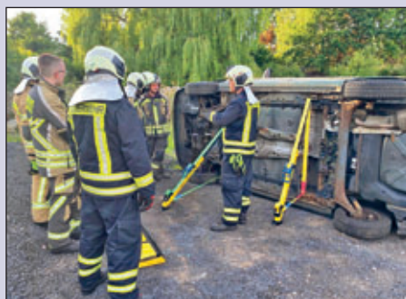
So steht das regelmäßige Training mit der Spezialtechnik für Hilfeleistungseinsätze im Vordergrund.