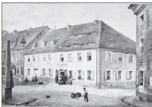
Wilsdruff, Ecke Marktgasse, Zeichnung, 19. Jh.