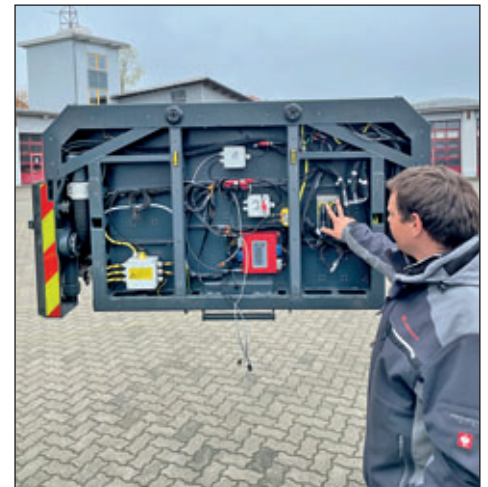
Zwei Kameraden der Ortswehr Wilsdruff waren in Heidenau zum Lehrgang „Gerätewart Drehleiter“. Dort wurden spezielle Themen zur Pflege und Wartung des sehr komplexen Systems gezeigt. Im Lehrgang waren alle vier Feuerwehren (Heidenau, Kirchberg, Pirna, Wilsdruff) der Sammelbeschaffung vertreten.