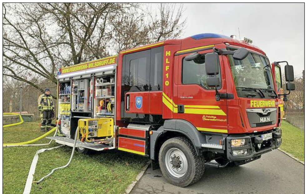
Das HLF10 der Ortswehr Mohorn