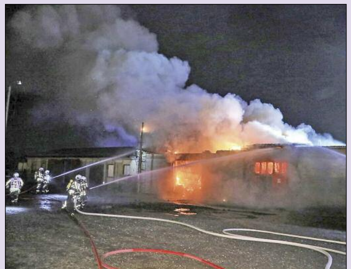
Brand eines Gewerbeobjekts in Braunsdorf am 14.12.2021