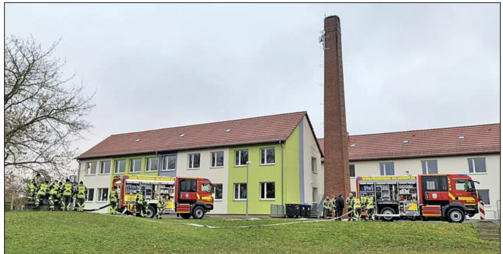
Gemeinsames Training an der Löschwasserzisterne der Grundschule Mohorn