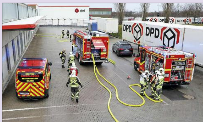
Brand Gefahrgutlager in Kesselsdorf am 11.03.2021