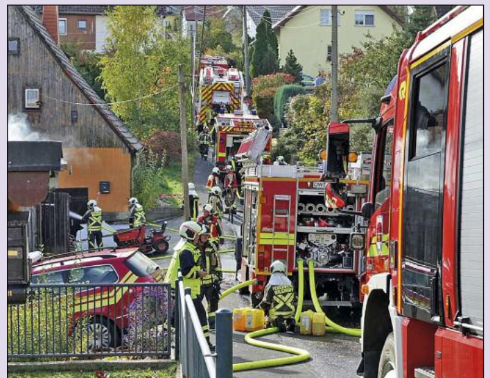
Brand eines Gewerbeobjekts in Kleinopitz am 19.10.2021