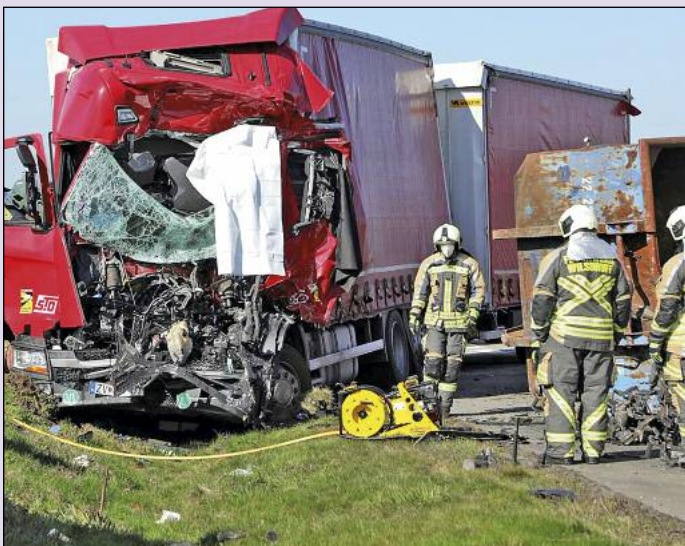
LKW-Unfall mit 2 eingeklemmten Personen auf der BAB4 am 30.03.2021