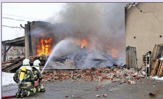
Großbrand in Wilsdruff am 19.01.2021

Der Coronapandemie zum Trotz hat die Freiwillige Feuerwehr Wilsdruff mit seinen zwölf leistungsfähigen Ortswehren auch 2021 viele Ereignisse erlebt. Insgesamt fielen 195 Einsätze mit einer Mischung aus technischen Hilfeleistungen, Tragehilfen für den Rettungsdienst, Brandeinsätzen und sonstigen Kleinsätzen an. Die rund 290 Kameradinnen und Kameraden wurden zu 31 Brandeinsätzen (davon drei Großbrände und neun Mittelbrände), 138 Hilfeleistungseinsätzen und zu 18 Fehlalarmierungen gerufen. Bei acht Einsätzen leisteten die Kameradinnen und Kameraden