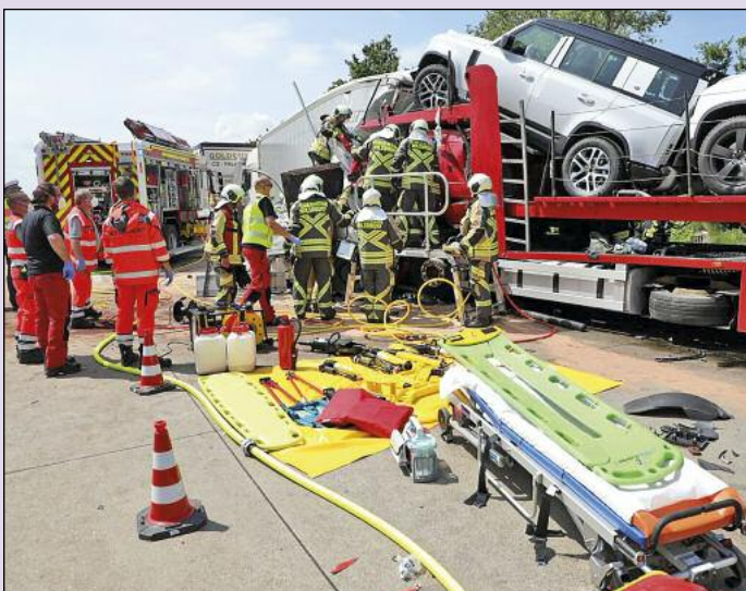
LKW-Unfall mit 2 eingeklemmten Personen auf der BAB4 am 09.06.2021