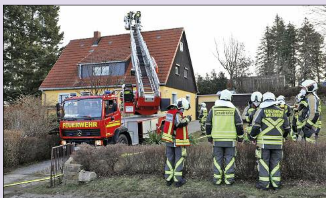
Schornsteinbrand in Herzogswalde am 24.02.2021