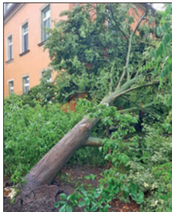
Bäume sind in Wilsdruff gegen Häuser gestürzt.