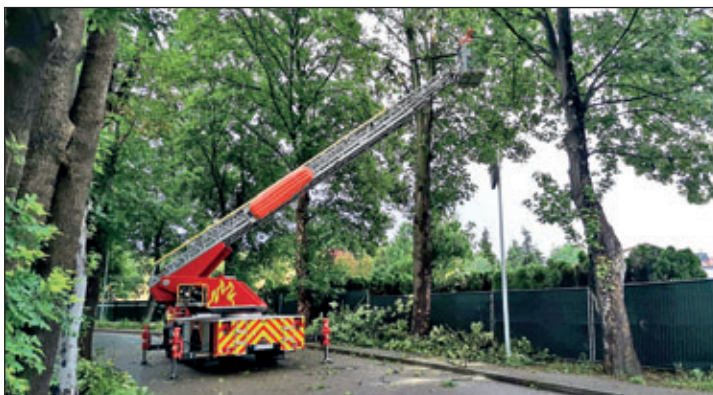
Angebrochene und lose Äste in Baumkronen werden mittels Drehleiter entfernt.