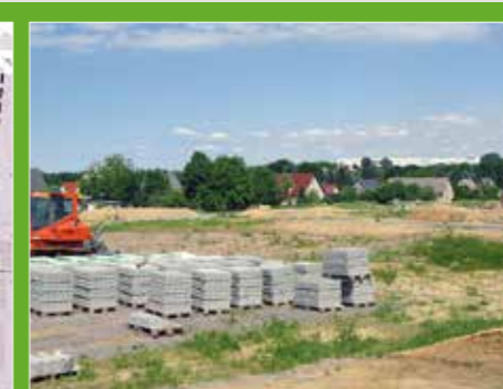
Das Baugebiet liegt am ruhigen Westrand der Stadt.