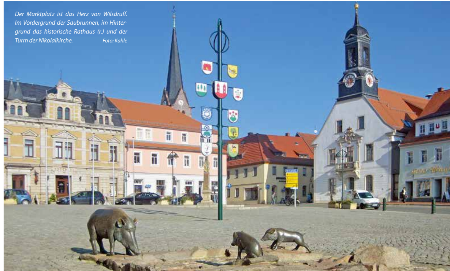
Der Marktplatz ist das Herz von Wilsdruff. Im Vordergrund der Saubrunnen, im Hintergrund das historische Rathaus (r.) und der Turm der Nikolaikirche.

Paradebeispiel einer ostdeutschen Gemeinde, deren Erscheinungsbild nach jahrzehntelanger Vernachlässigung Stück für Stück zu alter Schönheit zurückgefunden hat. Seit den frühen 90er-Jahren haben städtebauliche Sanierungsprogramme des Bundes und des Freistaates Sachsen genauso wie das große Engagement privater Immobilieneigentümer dafür gesorgt, dass die Wilsdruffer Innenstadt nahezu vollständig saniert ist. Der Charme der historischen Fassaden und die schicke Kleinstadt-Beschaulichkeit sind zurück – aber Wilsdruff ist viel mehr als eine schöne Hülle.