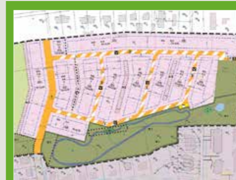
Hier ist noch reichlich Platz für neue Eigenheime.