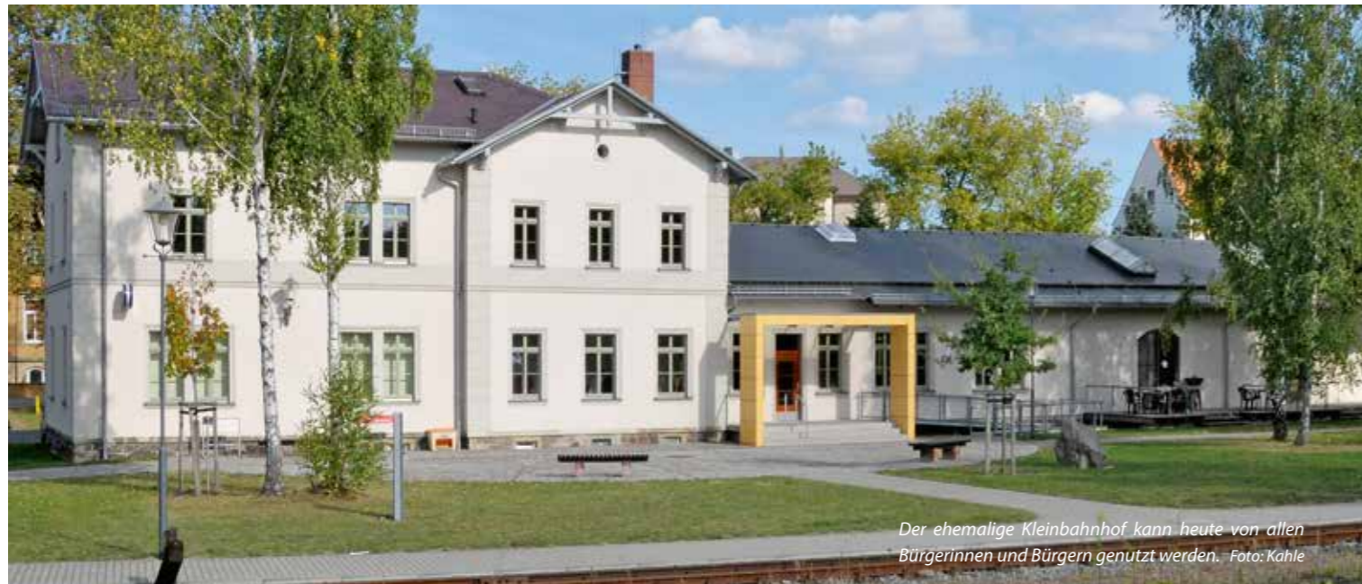
Der ehemalige Kleinbahnhof kann heute von allen Bürgerinnen und Bürgern genutzt werden.