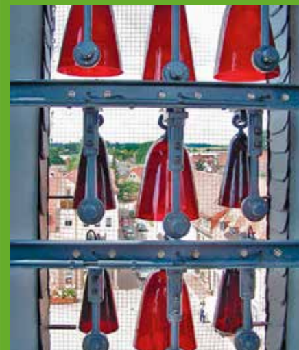
Das Glasglockenspiel im Rathausurm

gegenüber steht – wie in vielen Metropolregionen in Deutschland – eine zu geringe Zahl bebaubarer Grundstücke. Das Gute an der hohen Nachfrage nach Bauland: In den zu Wilsdruff gehörenden Dörfern werden jetzt immer mehr Baulücken geschlossen: „Etwa 70 Prozent der Bauanträge werden in unserer Gemeinde für Lücken gestellt, die übrigen Anträge entfallen auf Bebauungsplangebiete“, weiß Bürgermeister Rother zu berichten.