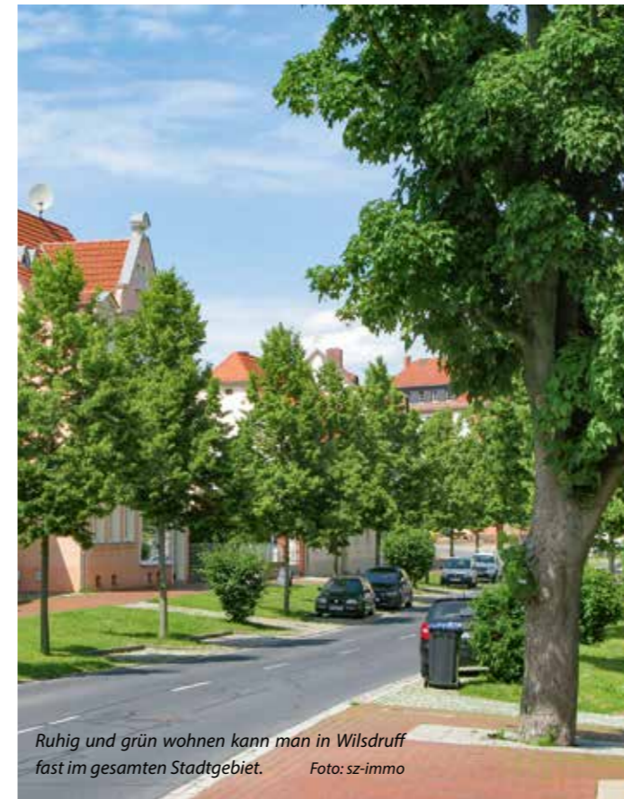
Ruhig und grün wohnen kann man in Wilsdruff fast im gesamten Stadtgebiet.