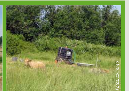
Wo jetzt noch Kühe weiden, fließt bald Regenwasser ab.