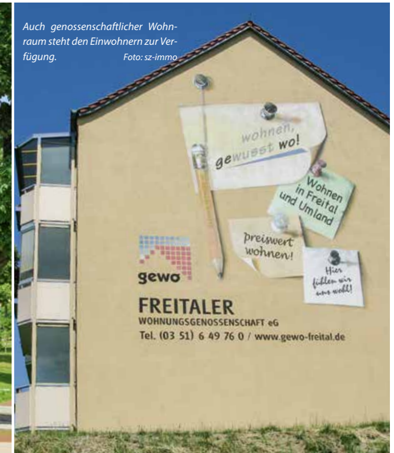
Auch genossenschaftlicher Wohnraum steht den Einwohnern zur Verfügung.