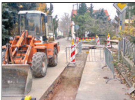
Bild). Parallel zu den Schmutzwasserkanalarbeiten wurde ein Regenwasserkanal verlegt. Durch die gemeinsame Verlegung konnten Kosten eingespart werden. Die abwassertechnische Erschließung des Nebensammlers „Neuer Weg“ wurde im August 2012 plangemäß abgeschlossen.

Im September wurde die abwassertechnische Erschließung mit dem Bau des Nebensammlers „Neue Heimat“ fortgesetzt. Damit dieser Nebensammler in Betrieb gehen kann, erfolgte eine Verlängerung des Sammlers „Maxim-Gorki-Straße“ in Richtung „Neue Heimat“. Um Grundstücke, die an diesem Sammler im Freigefälle auf der „Maxim-Gorki-Straße“ angebunden werden können anzuschließen, wurde ein Nebensammler in die Straße „Talblick“ verlegt. Der Anschluss, der direkt an den genannten Straßen liegenden Grundstücke erfolgte durch die ebenfalls schon realisierten Anschlusskanäle. Begonnen wurde die weitere Kanalverlegung ab der Einmündung „Talblick“ auf die „Maxim-Gorki-Straße“, um in der Folge den Nebensammler „Neue Heimat“ zu verlegen. Die Arbeiten wurden auf Grund der Wetterlage Anfang Dezember eingestellt.