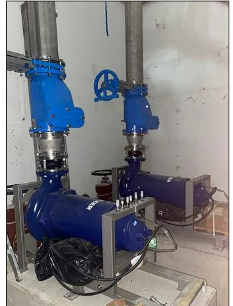
neu aufgestellte Pumpen

Die Bauarbeiten sollen im dritten Quartal 2022 abgeschlossen sein.