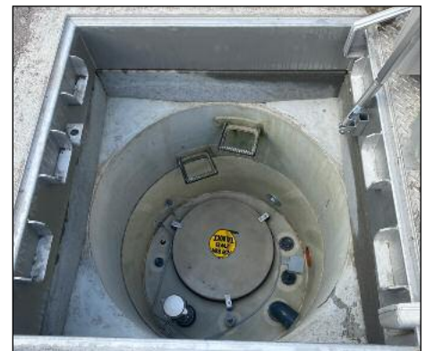
Blick in den Nutrioxschacht

Zum jetzigen Zeitpunkt erfolgt die Abwasserentsorgung der Ortslage Kleinopitz dezentral über Kleinkläranlagen. Über den Neubau eines Schmutzwasserpumpwerkes und den Anschluss an eine vorhandene Druckleitung, wird zunächst der Nordteil von Kleinopitz zentral erschlossen. Auf dem Grundstück des Dorfgemeinschaftshauses wird ein Schachtpumpwerk inklusive Nutrioxanlage errichtet. Vor dem ehemaligen Kulturzentrum wurden Ersatzparkplätze hergestellt. Die Ausschreibung erfolgte in zwei Los. Das Los 1 beinhaltet die Tiefbauarbeiten einschließlich der Errichtung des Pumpwerksbaukörpers mitsamt Be- und Entlüftung. Los 2 beinhaltet die technische Ausrüstung des Pumpwerks inklusive Errichtung einer Dosierstation für Nutriox. Die Bauarbeiten sollen im dritten Quartal 2022 abgeschlossen sein.