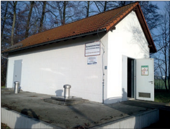
Außenansicht des Pumpwerkes „An der Mühle“

Teil angeschlossen werden soll. Auf dem Gelände des Dorfgemeinschaftshauses wird ein Schachtpumpwerk errichtet, welches die Abwasserüberleitung über die vorhandene Druckleitung bis nach Oberhermsdorf bewerkstelligt.