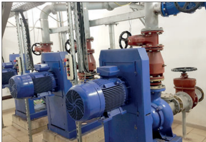
trocken aufgestellte Pumpen im Pumpwerk

Das Hauptpumpwerk „An der Mühle“ in Grumbach wurde im Jahr 1996 errichtet. Aufgrund des großen angeschlossenen Einzugsgebietes im Verbandsgebiet, besitzt das Hauptpumpwerk eine herausgehobene Bedeutung. Die Lebensdauer einiger Anlagengruppen ist